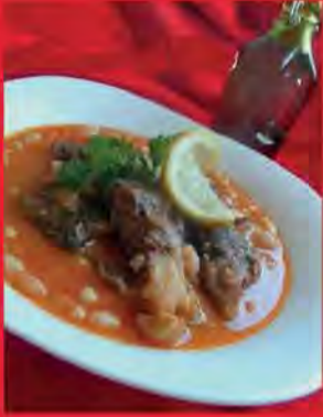
LOUBIA BEL KREWA3