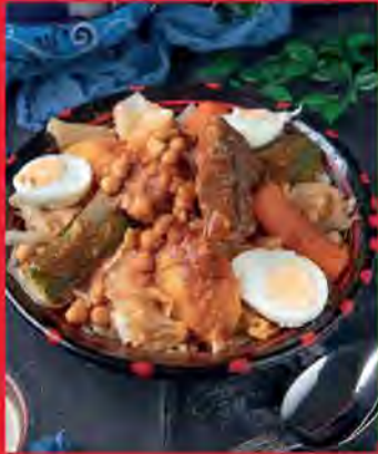
CHAKHCHOUKHA DE BISKRA