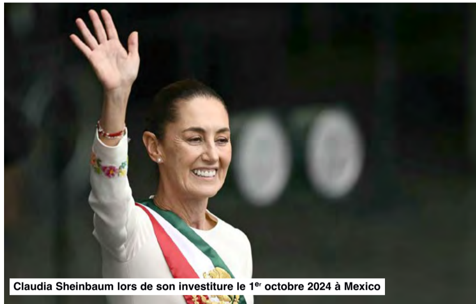
Claudia Sheinbaum lors de son investiture le 1 er octobre 2024 à Mexico

Malgré les incertitudes économiques mondiales, l'Amérique latine a fait preuve de résilience en 2024, même si les défis de la reprise post-pandémie – croissance lente et chômage