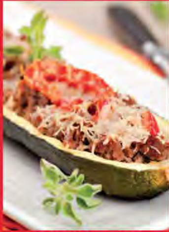
COURGETTES FARCIES À LA VIANDE HACHÉE