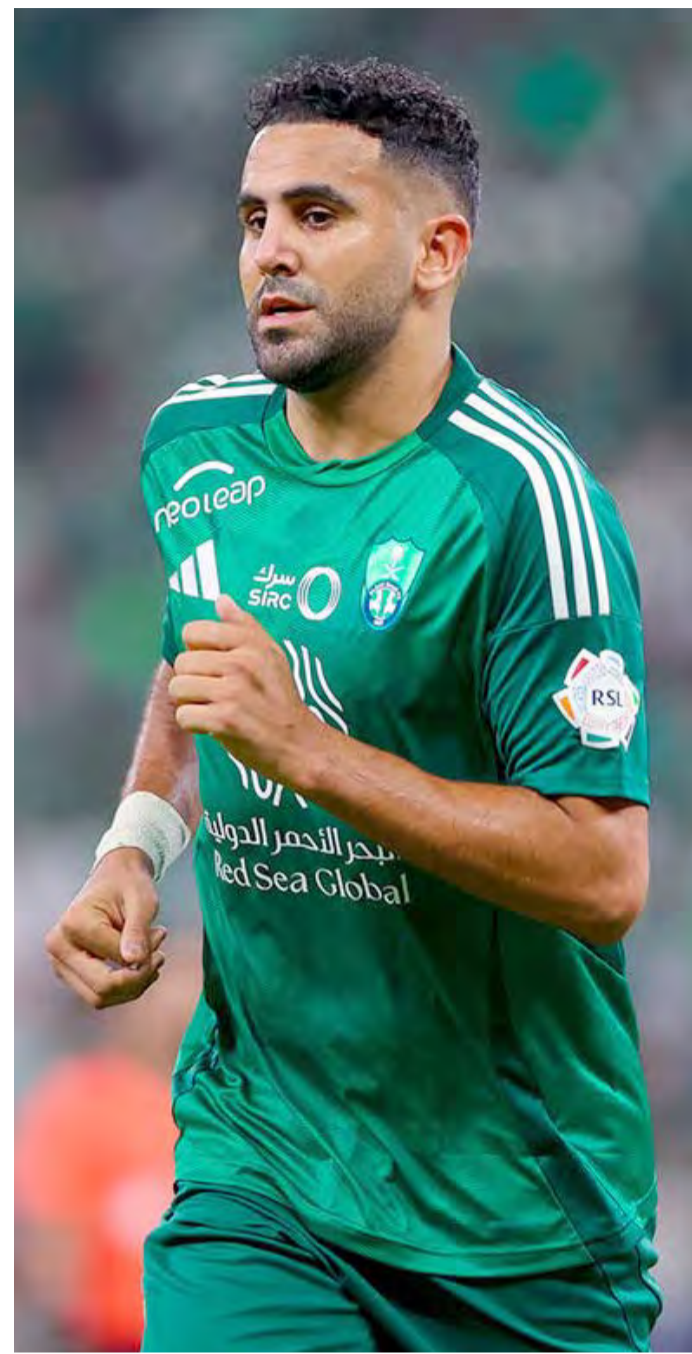
Al-Ahly et un joueur d'exception dans un championnat qui regorge de talents internationaux. C'est ce qui explique l'attache-

Avec 4 buts, dont le dernier en date le week-end dernier, et une passe décisive en 13 titularisations cette saison en championnat, Riyad Mahrez continue d'afficher une contribution offensive notable, portant son total à 5 contributions directes cette saison. Ces performances ne laissent aucun doute : Mahrez demeure un atout majeur pour