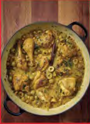
RAGOÛT DE POULET