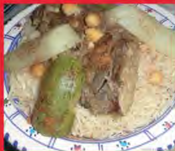
RECHTA À LA VIANDE D'AGNEAU ET À LA SAUCE BLANCHE