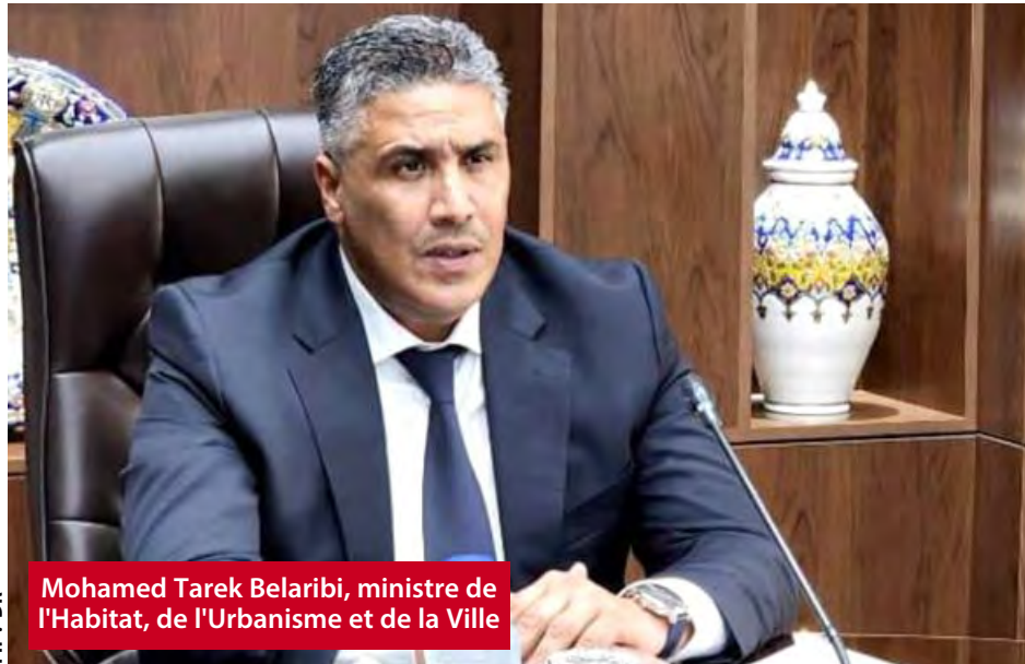
Mohamed Tarek Belaribi, ministre de l'Habitat, de l'Urbanisme et de la Ville

Le ministre a ordonné aux directeurs de formuler quatre propositions pour les plans d'aménagement en définissant la capacité d'accueil des logements, et de réaliser une étude sur la nature du sol.