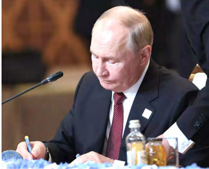
Ph. D. G.

Le président russe a signé hier, un décret approuvant la mise à jour de la doctrine nucléaire, annoncée pour rappel, fin septembre, celle-ci élargit les possibilités de recours à l'arme nucléaire, considérant, notamment comme une attaque conjointe l'agression menée par un État non nucléaire soutenu par une puissance nucléaire.