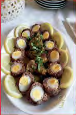
Mfechech fi ahdjeur mo