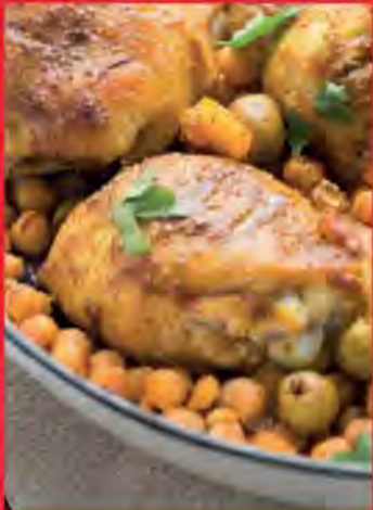
Tajine Poulet, citrons confits & abricots