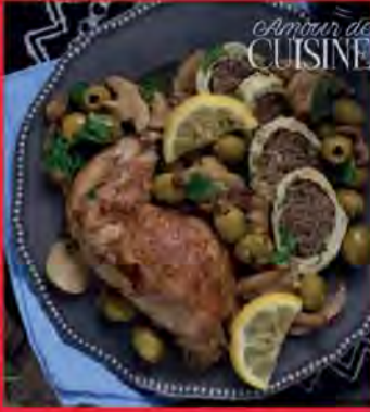
TAJINE DE ROULÉ DE POULET À LA VIANDE AUX CHAMPIGNONS