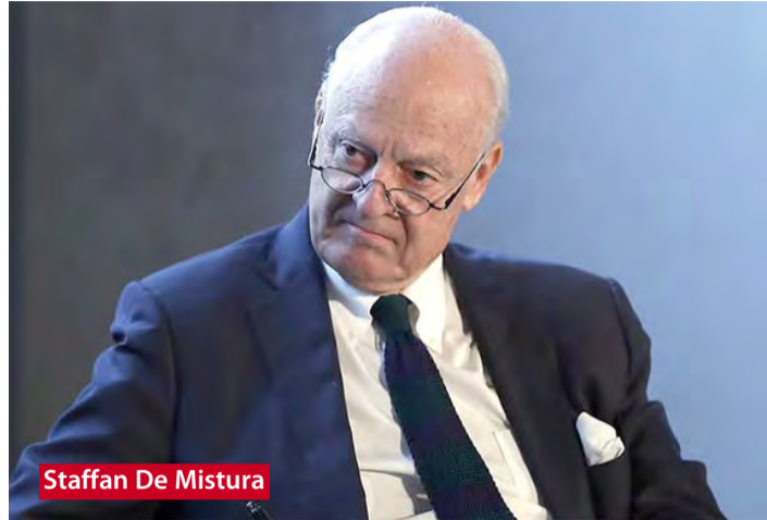
Staffan De Mistura

Staffan De Mistura, l'envoyé personnel du secrétaire général des Nations unies entamera, aujourd'hui, une visite dans les camps de réfugiés sahraouis.