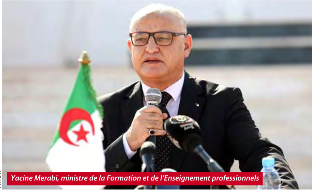
Yacine Merabi, ministre de la Formation et de l'Enseignement professionnels

À moins d'une semaine de la rentrée, le ministre de la Formation et de l'Enseignement professionnels, Yacine Merabi, a mis l'accent, lors de sa visite de travail dans la wilaya, de Bordj Bou Arréridj, sur « la nécessité de réviser la carte de formation de sorte à l'adapter à la spécificité économique de chaque région du pays ».