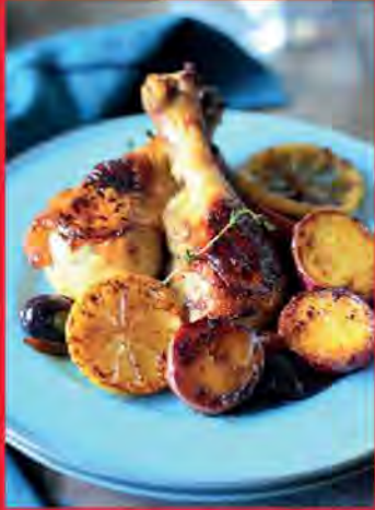
POULET AU CITRON