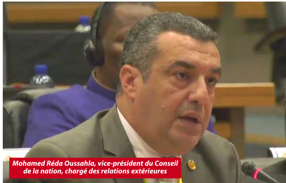
Mohamed Réda Oussahla, vice-président du Conseil de la nation, chargé des relations extérieures

Le président du Conseil de la nation a rappelé les mesures prises par l'Algérie à cet effet, notamment « l'adoption du livre numérique, l'équipement des écoles primaires en tablettes électroniques, la modernisation de l'Université, la création d'écoles d'intelligence artificielle et l'ouverture d'incubateurs dans les universités algériennes sans pour autant renoncer à la gratuité de l'éducation à tous les niveaux, qui est l'un des acquis sociaux immuables de l'État ». À ce titre, Goudjil a souligné que les politiques éducatives en Algérie visaient à « former des générations consciencieuses et citoyennes imprégnées des valeurs nationales découlant des principes de la glorieuse Révolution du 1er Novembre, lesquelles valeurs ont vocation à les protéger contre les fléaux répandus sur le continent africain et qui sont exploités par les puissances coloniales, les groupes terroristes et les mouvements extrémistes ». L'Algérie, poursuit-il, « demeure attachée à sa dimension africai-