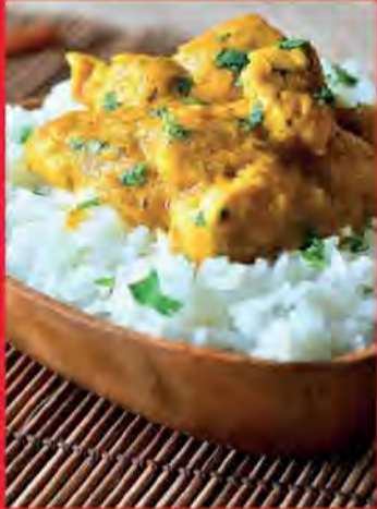
POULET AU CURRY INDIEN