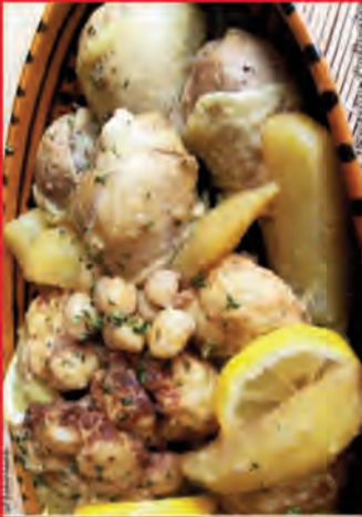
CHOU-FLEUR EN BEIGNETS