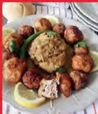
TAJINE EL KHOUKH