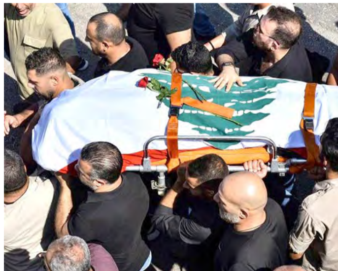
Les autorités libanaises.

Au moins 182 personnes sont tombées en martyrs et 727 autres dont des femmes des enfants et des secouristes ont été blessées hier dans des frappes intensives de l'armée sioniste sur le sud du Liban, a indiqué le ministère libanais de la Santé dans un nouveau bilan. Un précédent bilan a fait état de 100 martyrs et plus de 400 blessés.