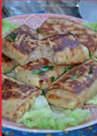
crêpes salées poulet champignons et béchamel