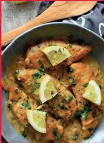
Casserole de poulet crémeux ail et citron