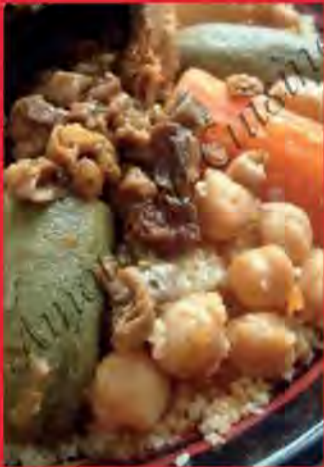
Osbane ou osbana de l'Aïd