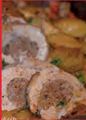
rôti de veau farci au four