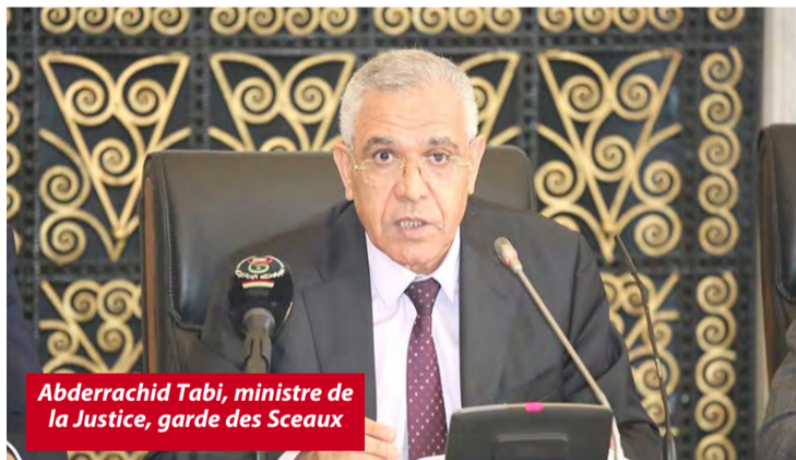
Abderrachid Tabi, ministre de la Justice, garde des Sceaux

Tabi a indiqué, lors d'une visite d'inspection qu'il a effectuée hier à Alger, avoir reçu des plaintes de citoyens en raison de l'obstruction à l'obtention de leurs papiers pendant une période de 3 jours, soulignant la nécessité de prendre en charge leurs préoccupations à travers le guichet unique dès que possible. Le ministre a ajouté qu'il faut prendre conscience de la