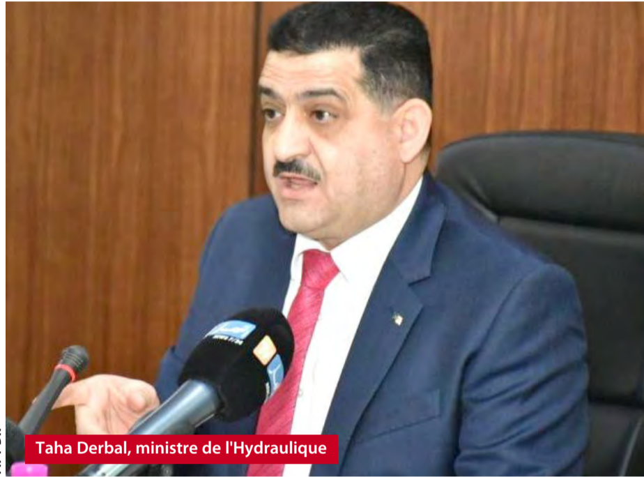
Taha Derbal, ministre de l'Hydraulique

Un événement qui s'étalera jusqu'à jeudi, sous le slogan "Avec une bonne gestion de l'eau, nous pouvons atteindre la prospérité ensemble et pour tous". L'occasion pour les participants à ce forum de débattre des défis liés à la gestion de l'eau et trouver des solutions durables, afin d'assurer un accès équitable à cette ressource vitale, alors que les changements climatiques ont impacté les populations les plus vulnérables dans le monde.