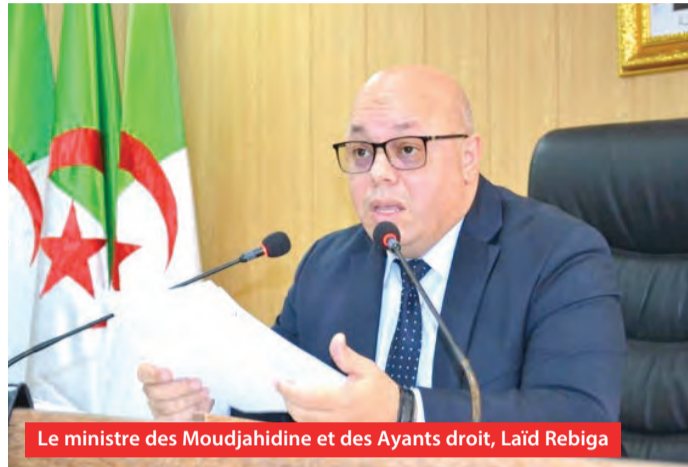
Le ministre des Moudjahidine et des Ayants droit, Laïd Rebiga

Le ministre des Moudjahidine et des Ayants droit, Laïd Rebiga, a souligné l'importance de se souvenir des jalons historiques, notamment ceux qui expriment avec force l'esprit et la cohésion nationaux et le chemin de lutte dont l'Algérie est fière.