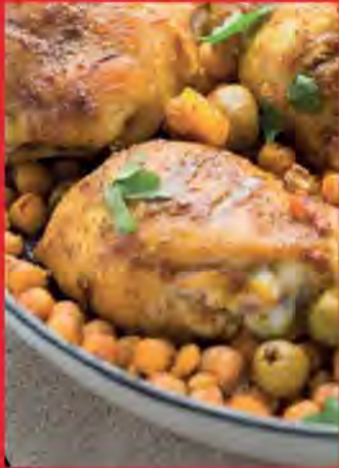
Tajine Poulet, citrons confits & abricots