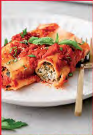
Cannelloni ricotta épinard et sauce tomate Mutti