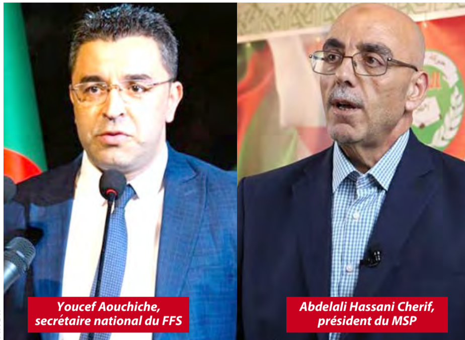
Youcef Aouchiche, secrétaire national du FFS

Alors que la date de la convocation officielle du corps électoral pour les élections présidentielles prochaines est prévue le 8 juin, et que le débat politique commence à s'installer, la scène politique est sortie de son silence pour les grandes manœuvres visant à réussir ce rendez-vous important dans l'édification de l'Algérie nouvelle.