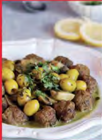
Tajine Zitoune et Kefta