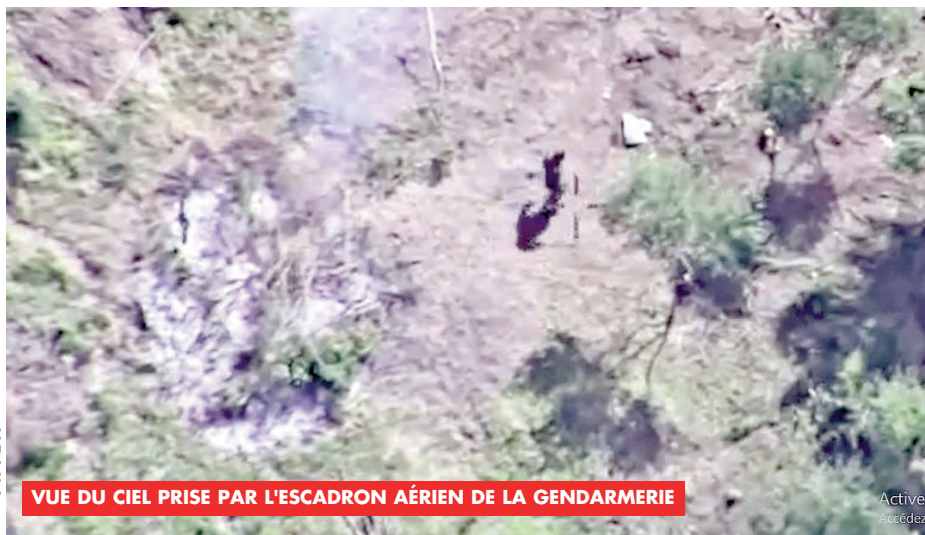
VUE DU CIEL PRISE PAR L'ESCADRON AÉRIEN DE LA GENDARMERIE

Les unités du groupement territorial de la Gendarmerie nationale à Skikda, appuyées par un hélicoptère de l'escadron aérien, a réussi, à capturer trois personnes prises en flagrant délit en train de mettre le feu dans l'espace végétal dans la commune de Tamalous, à quelque 50 kilomètres du chef-lieu de cette wilaya du nord-est.