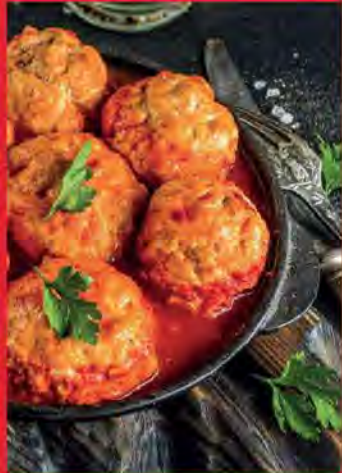
Boulettes de poisson