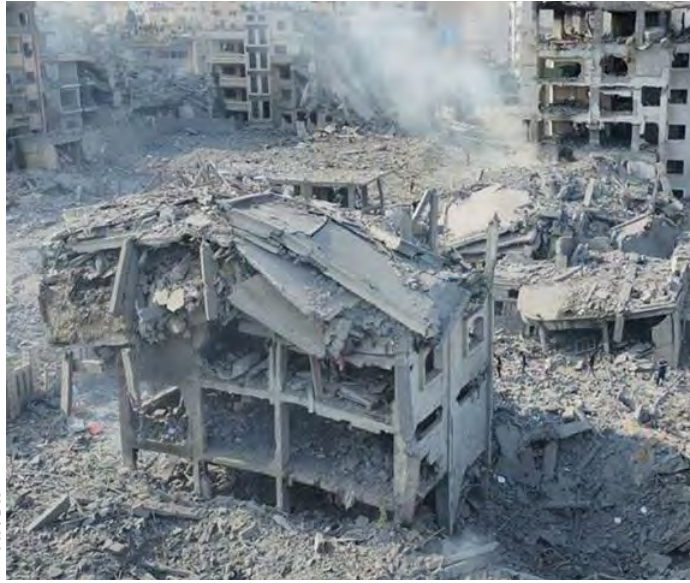
35 CORPS DE MARTYRS DANS DES FOSSES COMMUNES...

Les forces d'occupation ont été accusées d'avoir perpétré trois massacres au cours des dernières 24 heures, causant la mort de 32 citoyens palestiniens et blessant 59 autres. Les attaques comprenaient des tirs de missiles, d'artillerie et d'armes à feu sur différentes parties de la bande de Ghaza. Les quartiers d'Al-Zaytoun, Al-Shuja'iya et Al-Touffah, à l'est de la ville de Gaza, ont été particulièrement visés, entraînant la mort d'au moins trois personnes et blessant une dizaine d'autres, selon les rapports de Wafa. Des zones au sud-ouest de la ville de Ghaza ont également été prises pour cibles par l'artillerie de l'occupant sioniste, avec des explosions et des tirs d'armes à feu entendus. Dans le centre de la bande de Ghaza, des avions de combat de l'entité sioniste ont attaqué les environs de Wadi Gaza, au nord du camp de Nuseirat, et la zone au sud-est du camp de Bureij, faisant plusieurs blessés. Les victimes palestiniennes ont été transportées à l'hôpital des martyrs d'Al-Aqsa à Deir al-Balah. Le camp de réfugiés de Nuseirat a également été touché, blessant plusieurs Palestiniens. Au sud de la bande de Ghaza, l'artillerie de l'entité sioniste a visé les zones est de la ville de Khan Younes, tandis que des tirs intenses de véhicules militaires ont été signalés à l'est de la ville de Rafah. Le bilan de l'agression contre la bande de Ghaza a atteint 34 183 martyrs et 77 143 blessés depuis le 7 octobre dernier, selon les autorités palestiniennes de la Santé.