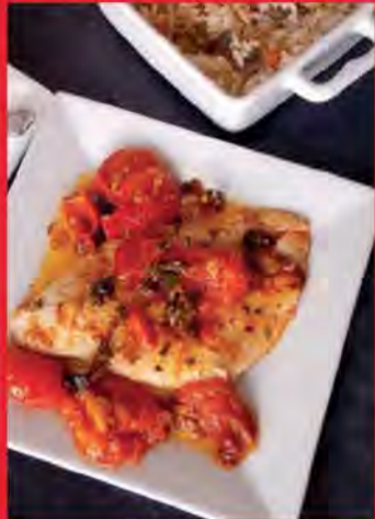
Sole au four aux herbes fines