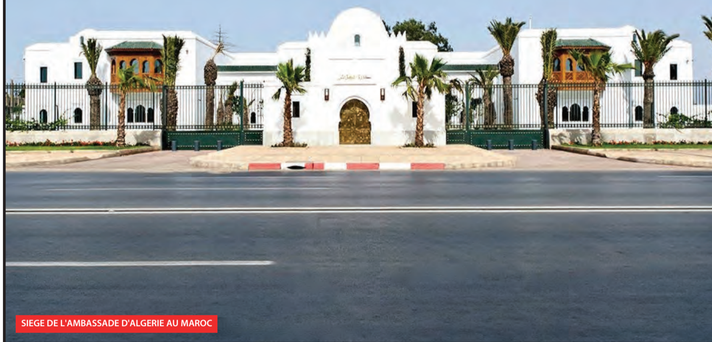
SIEGE DE L'AMBASSADE D'ALGERIE AU MAROC