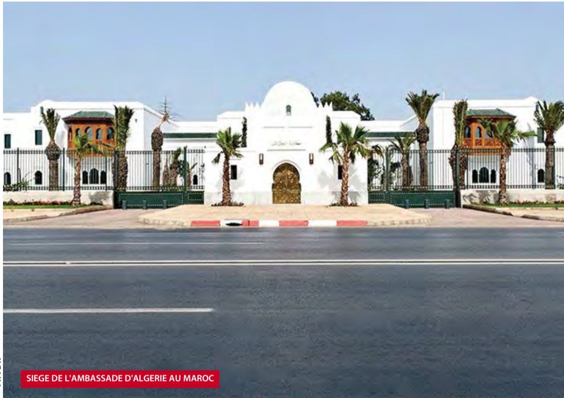
SIEGE DE L'AMBASSADE D'ALGERIE AU MAROC

Face à cette entreprise belliqueuse par laquelle le Maroc a signé une provocation de trop, le Gouvernement algérien répondra par tous les moyens qu'il jugera appropriés.