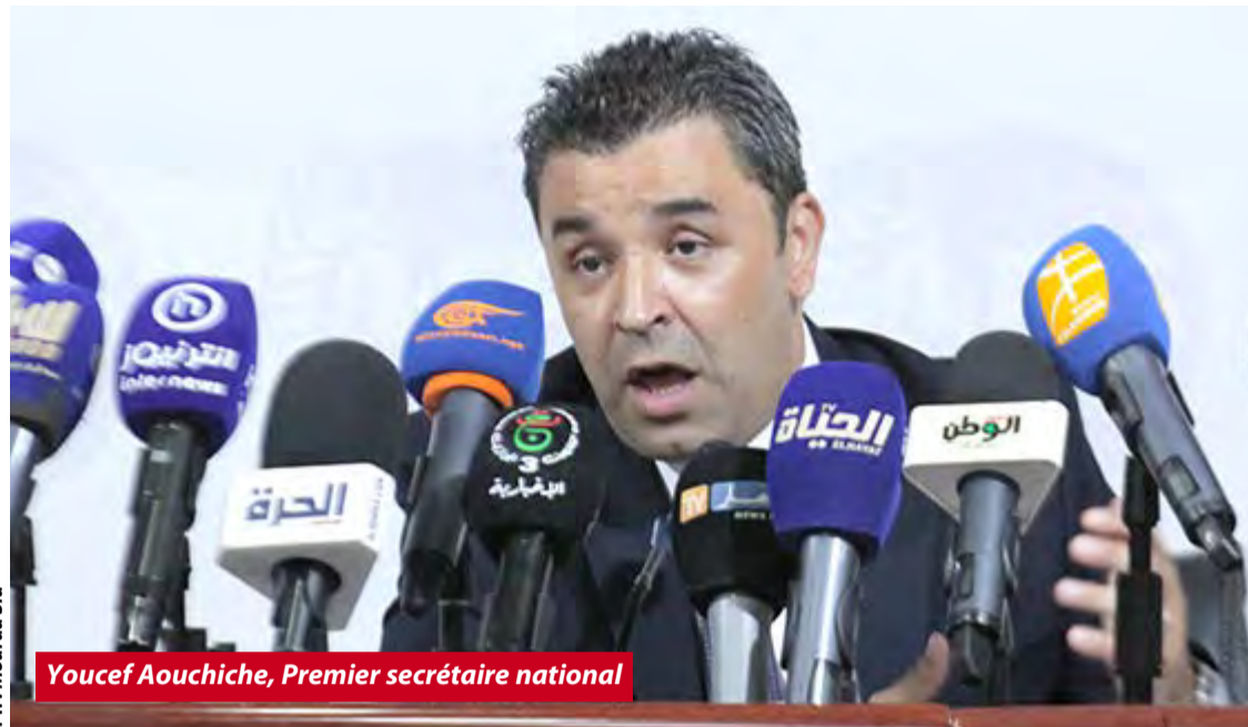
Youcef Aouchiche, Premier secrétaire national

Le Premier secrétaire national, Youcef Aouchiche, a, d'emblée, affirmé que cette nouvelle initiative vise à réhabiliter l'action politique et ses valeurs et surtout à démontrer au pouvoir que la classe politique avec ses différentes orientations est capable de se mettre d'accord sur un pacte national unificateur et de jouer son rôle mobilisateur qui lui est sien au sein de la société pour défendre le pays et ses intérêts. Il a précisé que si le parti a décidé d'entreprendre cette initiative, c'est parce qu'il est conscient des risques auxquels est confronté le pays notamment avec les mutations internationales, et les bouleversements au niveau régional, qui nécessitent pour pouvoir y faire face à l'édification d'un État de droit en mesure de défendre ses intérêts avec un front interne fort et solide. Cette initiative, ajoute l'orateur, s'adresse à toutes les forces politiques qui s'identifient dans le processus de l'édification d'un État de droit, respectueux des libertés, et qui luttent pour la