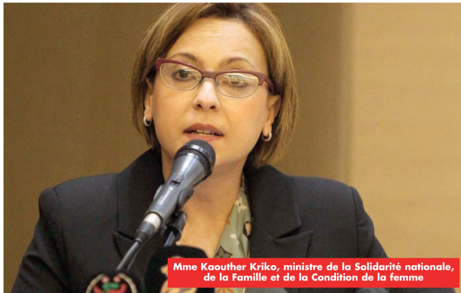
Mme Kaouther Krikou, ministre de la Solidarité nationale, de la Famille et de la Condition de la femme