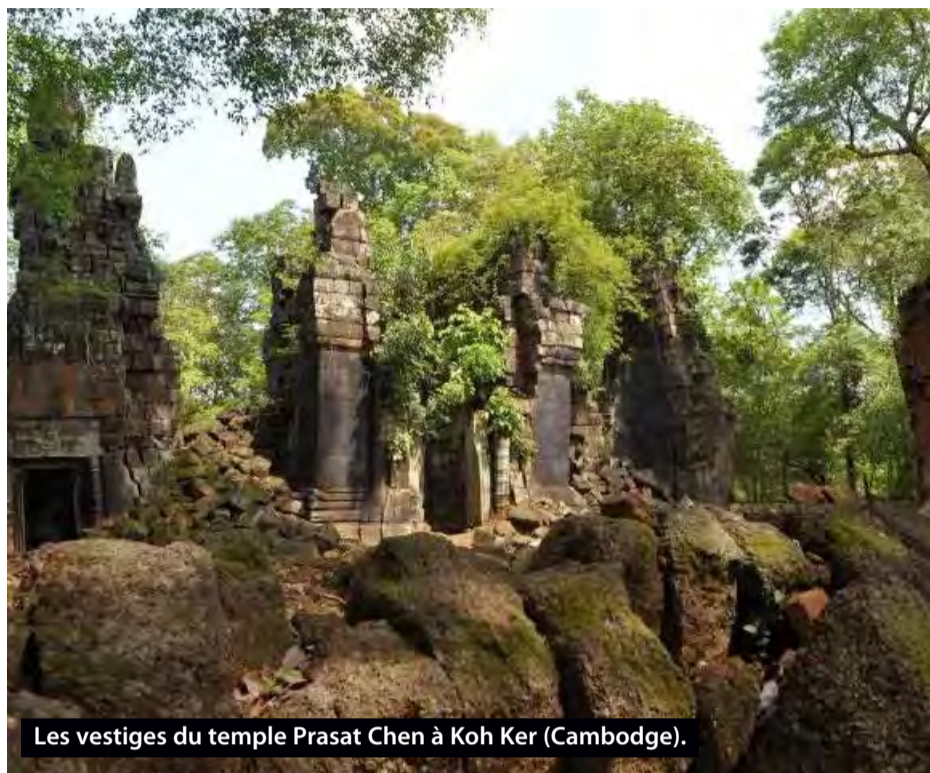
Les vestiges du temple Prasat Chen à Koh Ker (Cambodge).

pour leurs vastes "forêts hyrcaniennes", à l'impressionnante biodiversité.