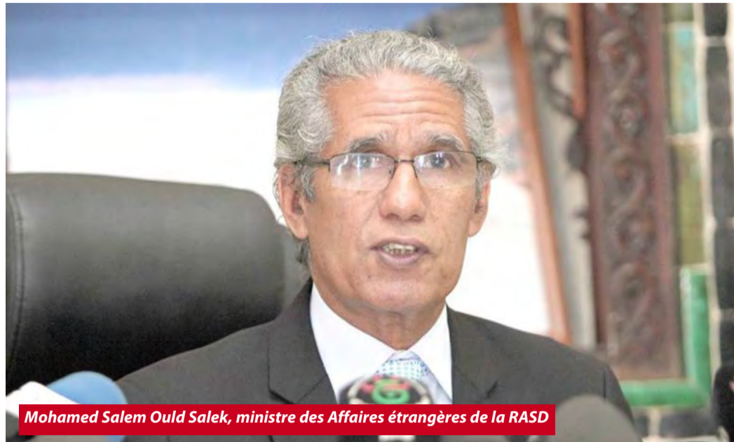
Mohamed Salem Ould Salek, ministre des Affaires étrangères de la RASD

Rabat continue de verser dans le déni du droit international des résolutions du Conseil de sécurité et de l'Assemblée générale de l'ONU et du droit du peuple sahraoui à un référendum d'autodétermination, a indiqué dimanche le ministère sahraoui des Affaires étrangères qui a rappelé que le règlement du conflit au Sahara occidental doit être conforme à la charte des Nations unies et de la charte constitutive de l'Union africaine (UA).