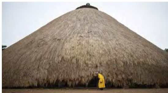
L'incendie de 2010 avait provoqué une vive émotion parmi les Baganda, sujets des rois du

La moitié des sites inscrits sur la liste du patrimoine en péril est située sur le continent. L'ancien palais des "kabakas", construit en 1882 et converti en sépulture royale en 1884, constitue "un exemple exceptionnel du style architectural développé par le puissant royaume de Buganda à partir du XIIIe siècle", selon l'Unesco.