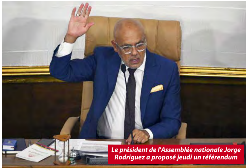
Le président de l'Assemblée nationale Jorge Rodríguez a proposé jeudi un référendum