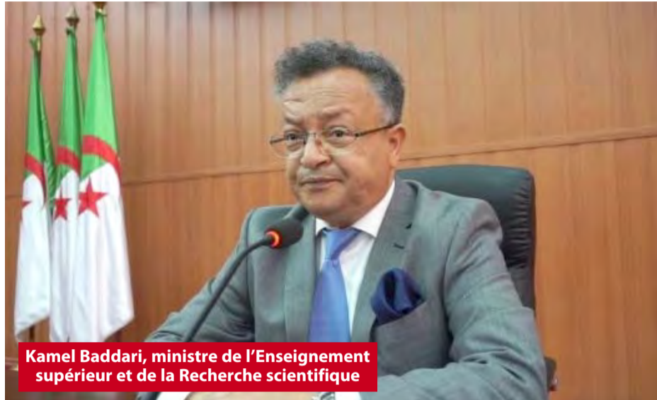
Kamel Baddari, ministre de l'Enseignement supérieur et de la Recherche scientifique

Le ministre de l'Enseignement supérieur et de la Recherche scientifique, Kamel Baddari, qui donnait hier le coup d'envoi de l'année universitaire 2023/2024 depuis la wilaya de Guelma, a affirmé que « l'Algérie nouvelle veut faire de l'université à travers l'enseignement, la recherche et l'innovation, une locomotive de développement et un moteur de l'économie nationale », rappelant que parmi les 54 engagements du président Tebboune, 11 sont liés à l'enseignement supérieur et la recherche scientifique.