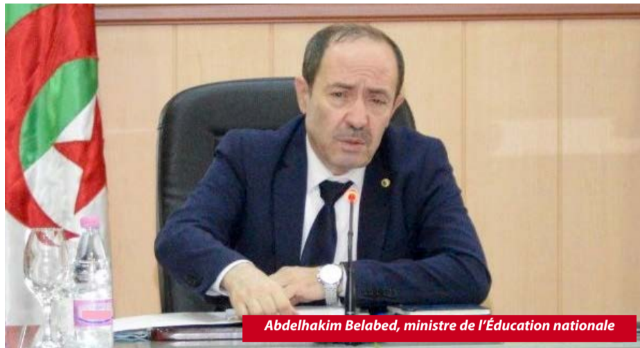
Abdelhakim Belabed, ministre de l'Éducation nationale

Dans le cadre de la prise en charge de la surcharge des classes, le ministre a appelé les responsables locaux à faire un