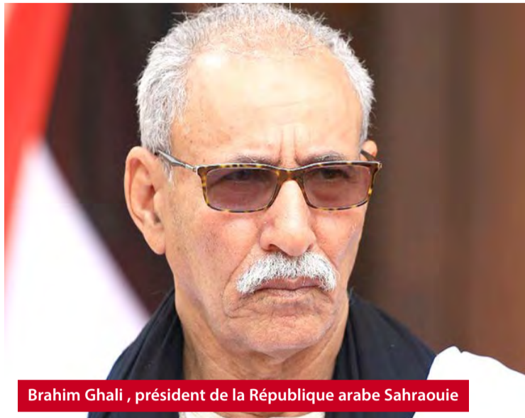
Brahim Ghali, président de la République arabe Sahraouie

Dans son discours prononcé à l'occasion de la clôture de l'université d'été des cadres du Front Polisario tenue dans la wilaya de Boumerdès, le président de la République arabe sahraouie, Brahim Ghali a dénoncé la répression et les exactions que subissent les Sahraouis dans les territoires occupés et le sud du Maroc et le blocus qu'ils vivent au quotidien tout en appelant l'ONU à assumer ses responsabilités pour faire cesser les atteintes aux droits de l'Homme, lever le blocus imposé au peuple sahraoui et libérer les héros de l'épopée de Gdem Izik et tous les détenus sahraouis.