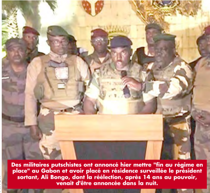
Des militaires putschistes ont annoncé hier mettre "fin au régime en place" au Gabon et avoir placé en résidence surveillée le président sortant, Ali Bongo, dont la réélection, après 14 ans au pouvoir, venait d'être annoncée dans la nuit.

Avant de s'adonner à énumérer les principes contenus dans la solution proposée, le ministre Attaf, a mis en lumière la bonne foi du Président ayant motivé l'élaboration de son approche politique. Le chef de l'État a voulu à travers cette initiative, affirme, le chef de la diplomatie algérienne, démontrer que la solution politique est toujours possible au Niger, assurant que le président Tebboune a tenu à faire connaître son approche et la soumettre à la communauté internationale par souci de transparence et pour rallier le maximum de soutien à cette approche. Selon le chef de la diplomatie algérienne, le président Tebboune, a adopté, dans l'élaboration de son initiative, le principe de la souplesse pour permettre son enrichissement en accueillant toutes les propositions d'où qu'elles viennent, et que cette approche reste ouverte à tous les pays frères et à tous ceux qui veulent contribuer à la résolution pacifique de la crise au Niger. S'agissant de ces contours, Attaf, a fait savoir, que l'approche politique algérienne s'articule autour de six axes et s'inscrit dans le cadre d'une