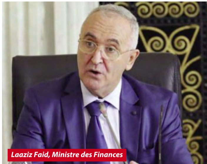
Laâziz Faïd, Ministre des Finances

En marge d'une visite de travail effectuée mardi à Béjaïa- la wilaya la plus affectée cette