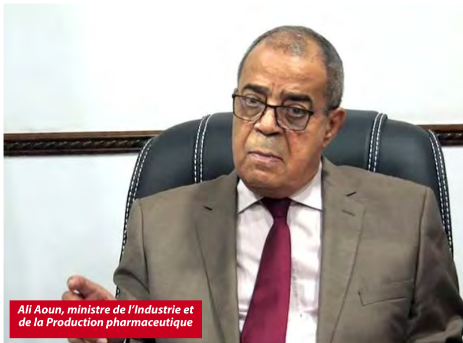
Ali Aoun, ministre de l'Industrie et de la Production pharmaceutique

de production de l'ENIEM Tizi-Ouzou, les responsables de cette dernière ont relevé que l'entreprise produisait en deçà de ses capacités réelles. Ainsi, sur une capacité totale de production de 220.000 appareils, l'ENIEM n'en a produit en 2022 que 35.000.