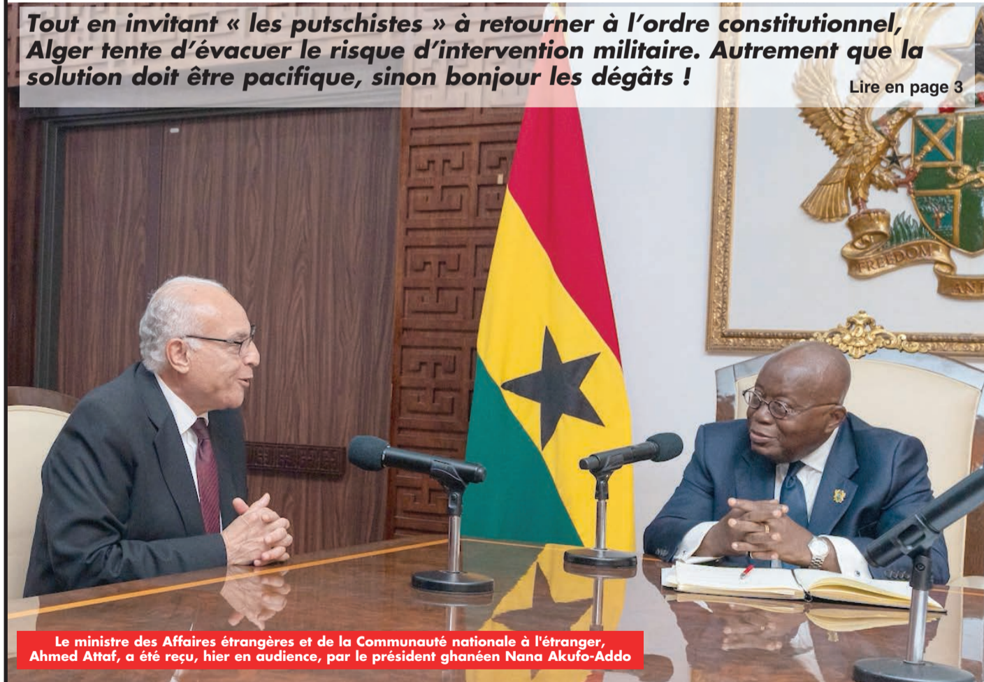
Le ministre des Affaires étrangères et de la Communauté nationale à l'étranger, Ahmed Attaf, a été reçu, hier en audience, par le président ghanéen Nana Akufo-Addo