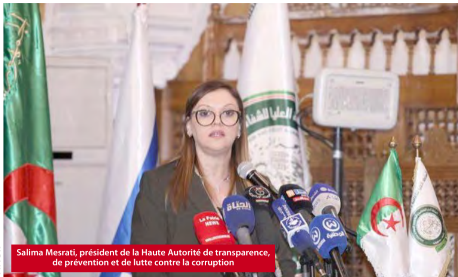
Salima Mesrati, présidente de la Haute Autorité de transparence, de prévention et de lutte contre la corruption

La Haute Autorité de transparence, de prévention et de lutte contre la corruption, tiendra aujourd'hui, sous le haut patronage du président de la République, Abdelmadjid Tebboune, un Forum dédié à la lutte contre le phénomène de la corruption. A l'occasion, la Stratégie nationale de transparence, de prévention et de lutte contre la corruption (2023-2027) sera officiellement lancée.