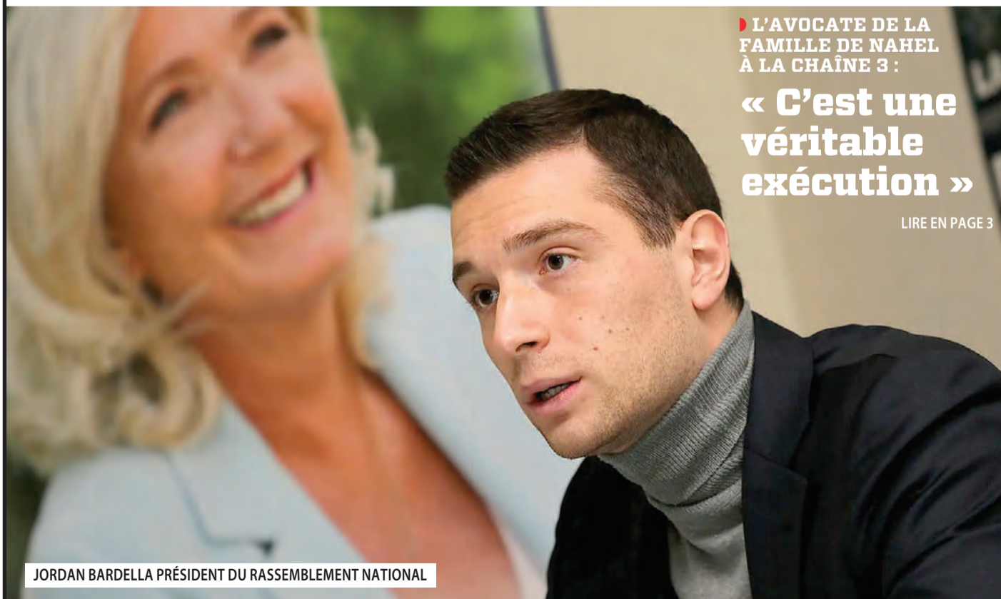
JORDAN BARDELLA PRÉSIDENT DU RASSEMBLEMENT NATIONAL