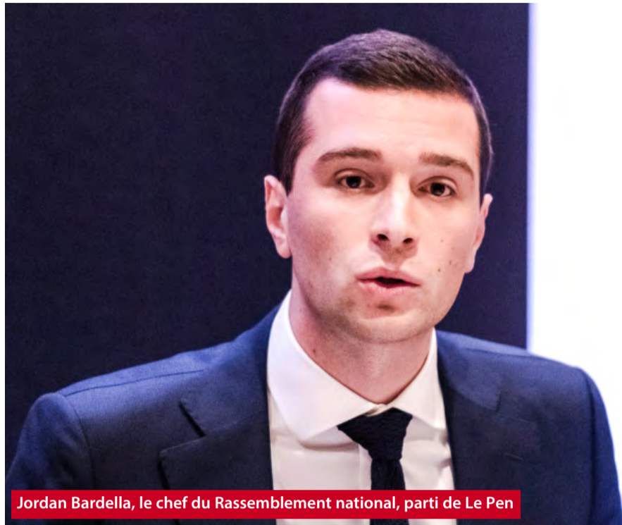
Jordan Bardella, le chef du Rassemblement national, parti de Le Pen