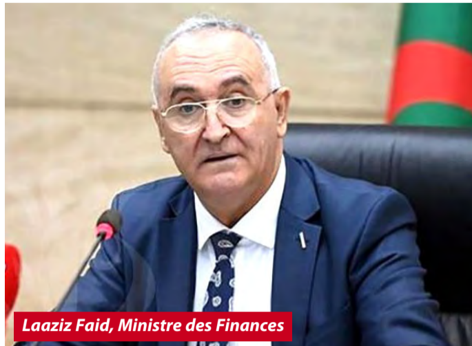
Laaziz Faid, Ministre des Finances

Le ministre des Finances, Laaziz Faid, a exhorté l'ensemble des responsables des banques à s'orienter vers les technologies les plus innovantes dans la digitalisation des prestations et produits bancaires.