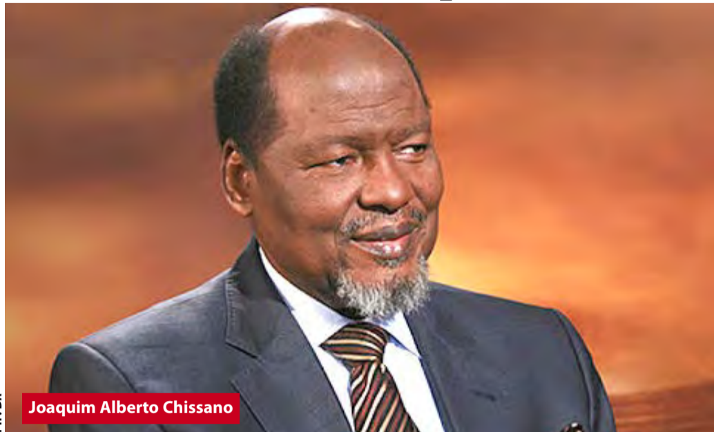
Joaquim Alberto Chissano

Annoncée lors du Colloque international des amis de la révolution algérienne, tenu à Alger les 17 et 18 mai 2022, la création de l'Association internationale des amis de la Révolution algérienne, a eu pour objectif la préservation des valeurs et principes de la Révolution du 1er novembre 1954, dont se sont inspirées de nombreuses autres révolutions en Afrique, en Amérique Latine et en Asie, notamment le Vietnam et l'Afrique du Sud.