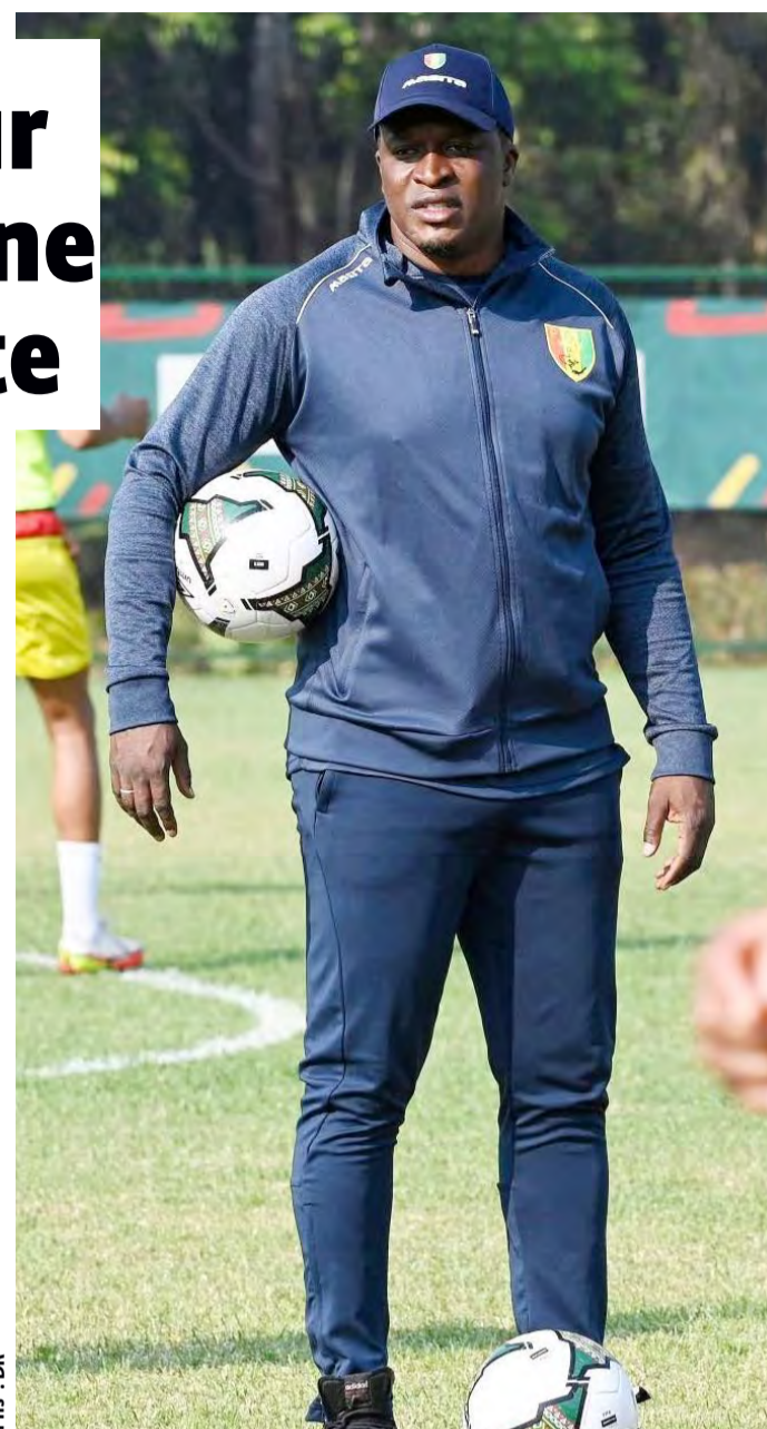
PHS - DR

L'historique des rencontres entre l'Algérie et la Guinée