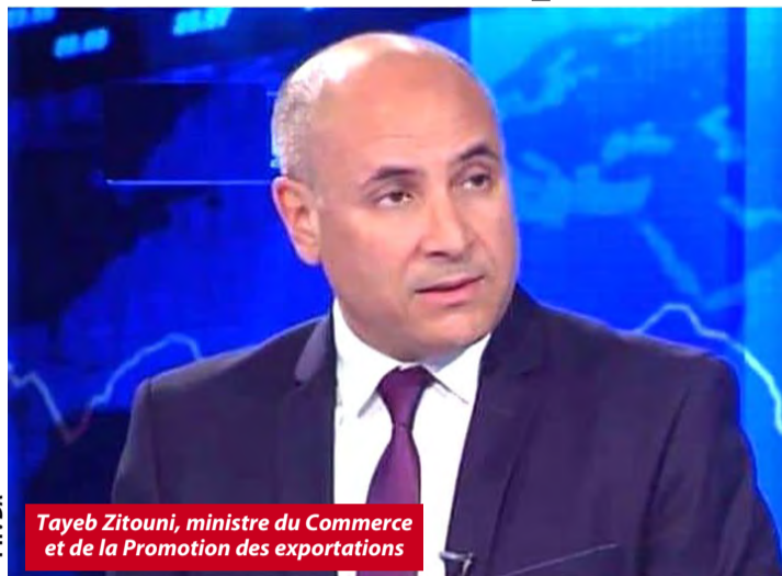
Tayeb Zitouni, ministre du Commerce et de la Promotion des exportations

Le ministre du Commerce et de la Promotion des exportations, Tayeb Zitouni, a donné devant la presse, le contenu de sa rencontre avec la délégation parlementaire du Land de Bavière (Allemagne), conduite par le président de l'Union chrétienne-sociale en Bavière, Thomas Kreuzer, qu'il a reçue, jeudi, en présence de l'ambassadrice d'Allemagne en Algérie.