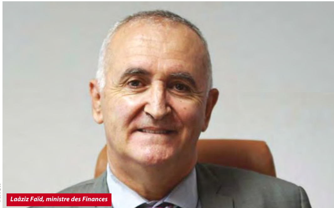
Laâziz Faïd, ministre des Finances

Parmi les éléments incontournables du développement de ce processus de modernisation du secteur des Finances, le concept de l'inclusion financière. Un facteur déterminant que le ministre du secteur, Laâziz Faïd, a évoqué jeudi dernier à l'occasion de la Journée arabe de l'inclusion financière. En marge d'une journée d'information, organisée, à cet effet, par l'Association professionnelle des banques et des établissements financiers (ABEF), sous la thématique : « L'inclusion financière et les changements climatiques », Faïd a mis en avant l'importance de « la densification et de l'élargissement du réseau des agences bancaires numériques et de proximité, ainsi que le renforce-