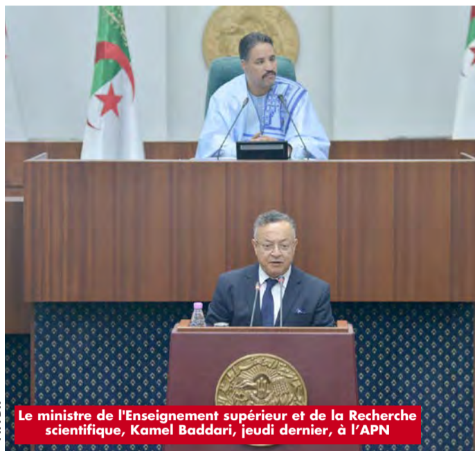
Le ministre de l'Enseignement supérieur et de la Recherche scientifique, Kamel Baddari, jeudi dernier, à l'APN

Évoquant jeudi à l'APN, l'inscription des nouveaux bacheliers au titre de l'année 2023, Badari a indiqué que la circulaire ministérielle d'orientation pour les nouveaux étudiants prévoyait l'adoption de deux modes d'orientation dans toutes les branches et spécialités, en se basant sur la moyenne pondérée et la moyenne générale. Il a abordé en outre la numérisation de tous les aspects liés à la prochaine rentrée universitaire, particulièrement les volets