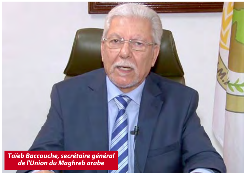
Taïeb Baccouche, secrétaire général de l'Union du Maghreb arabe

Le porte-parole du ministère des Affaires étrangères et de la Communauté nationale à l'étranger, a rappelé, à l'occasion,