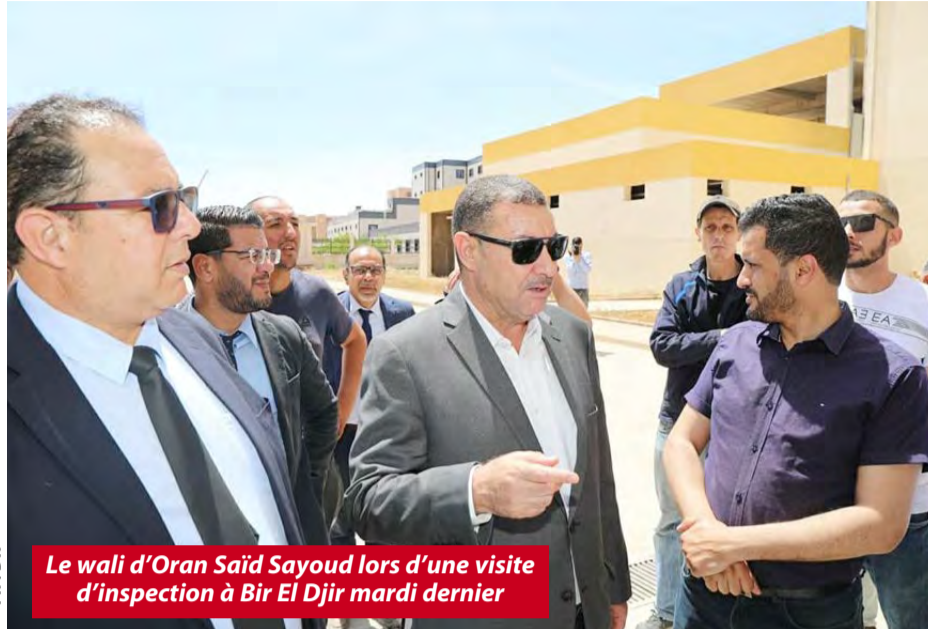
Le wali d'Oran Saïd Sayoud lors d'une visite d'inspection à Bir El Djir mardi dernier

Le chef de l'exécutif a indiqué, dans une déclaration à la presse, en marge de sa visite d'inspection des projets à Oran et à Bir El Djir que les travaux en cours des hôpitaux à Haï Nejma, d'une capacité de 240 lits, des urgences médicales à Oued Tlélat (120 lits), d'El Kerma d'une capacité de 60 lits et Gdyl (240 lits) sont achevés à 100 pour cent. Dans ce cadre, la Direction de la santé et de la population devra entamer les procédures nécessaires pour leur équipement. L'ouverture des hôpitaux de Gdyl et d'Oued Tlélat est prévue le 5 juillet prochain, date coïncidant avec la célébration de la fête de l'indépendance, sachant que les établissements ouvriront, l'un après l'autre, en fonction de leur équipement, avant la fin de l'année en cours, a précisé le wali. Concernant le projet de l'Institut national du cancer, en cours de réalisation à Oran, Sayoud a expliqué que les travaux de réalisation ont atteint un taux de 85%, soulignant que ce dernier dispose d'une structure dédiée aux hospitalisations d'une capacité de 120 lits, laquelle sera