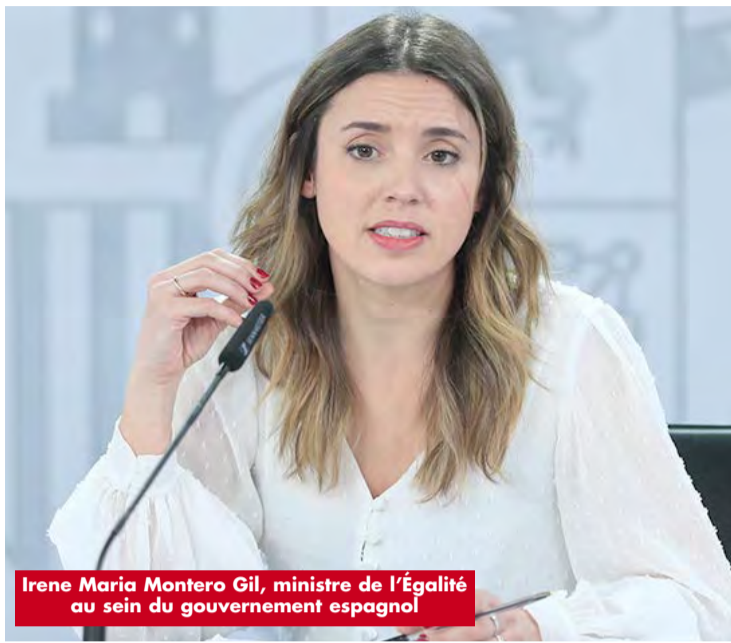
Irene Maria Montero Gil, ministre de l'Égalité au sein du gouvernement espagnol

La ministre de l'Égalité, au sein du gouvernement espagnol de Pedro Sanchez, Irene Maria Montero Gil, également membre du parti de gauche Podemos, a réitéré son soutien à la cause sahraouie lors de la cérémonie de l'installation des candidats du parti en prévision des prochaines élections communales et parlementaires dans la région de Tenerife, dans les Iles canaries.