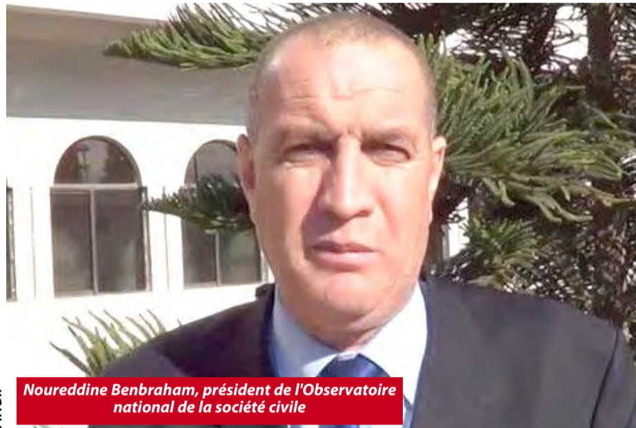
Noureddine Benbraham, président de l'Observatoire national de la société civile

Par sa présence aux côtés des membres de l'association "Amel El-Djazair", initiatrice de la kheima d'iftar, l'Observatoire national de la société civile entend "réaffirmer son soutien et son accompagnement aux associations qui contribuent à la cohésion sociale à travers leurs actions caritatives", a-t-il dit. En ce qui concerne les jeunes bénévoles participant à la distribution des repas chauds au